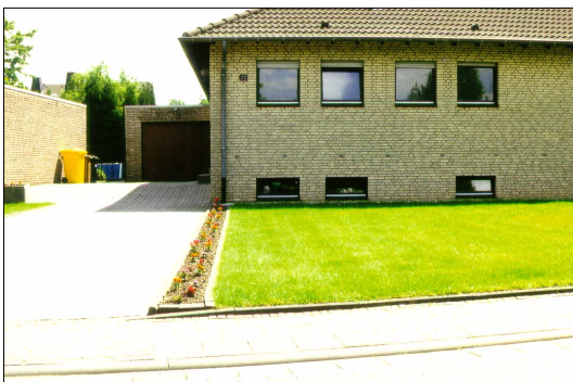
Natur im Städtebau?

STERN (1998) hat die Ergebnisse dieser Untersuchung in der in Hamburg erscheinenden Wochenzeitung "Die Woche" angemessen politisiert und darin auch das von Städten und Gemeinden immer wieder vorgeschobene Argument, der Naturschutz verteuere das Bauen, zurückgewiesen: "Klar, Ausgleichsmaßnahmen verursachen Kosten und die kommunalen Kassen sind leer. Aber analog zu den kommunalen Erschließungskosten von Bauland können auch die Kosten für naturschutzrechtliche Ausgleichsmaßnahmen auf Bauträger und Investoren umgelegt werden. Die EGE hat errechnet, daß solche Kosten weniger als 5 Prozent der Bausumme ausmachen - bei einem Einfamilienhaus der Aufwand für ein Gästeklo". Im übrigen haben es die Kommunen selbst in der Hand, mit einer am Naturschutz orientierten Flächenauswahl für neue