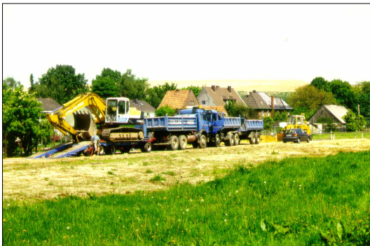
Zerstörung von Steinkauzlebensräumen für Wohnungsbau